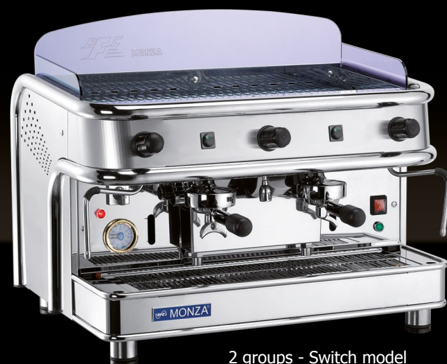
2 groups - Switch model