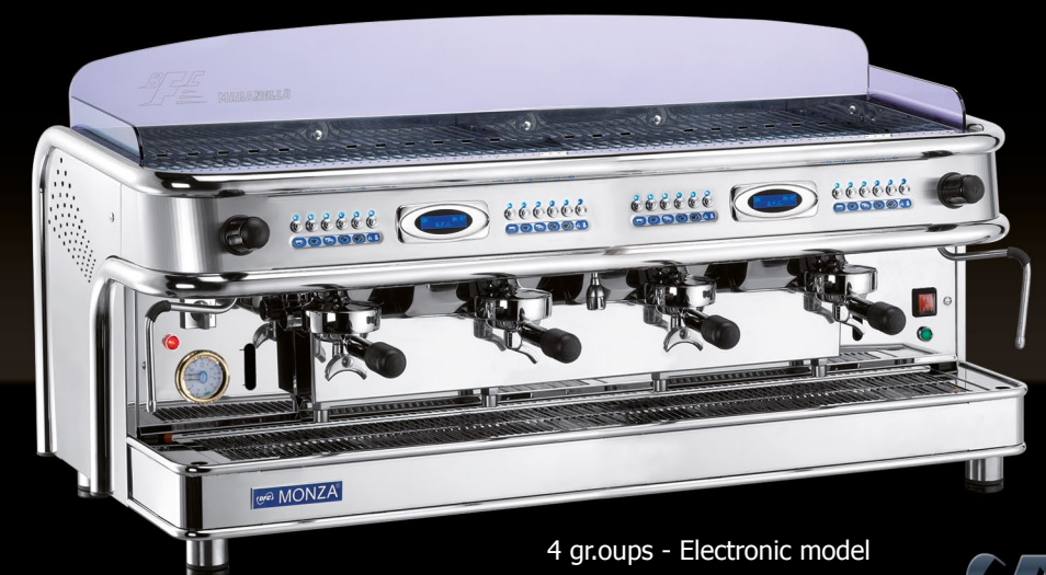
4 groups - Electronic model