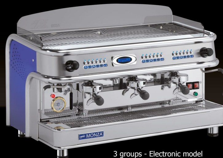
3 groups - Electronic model